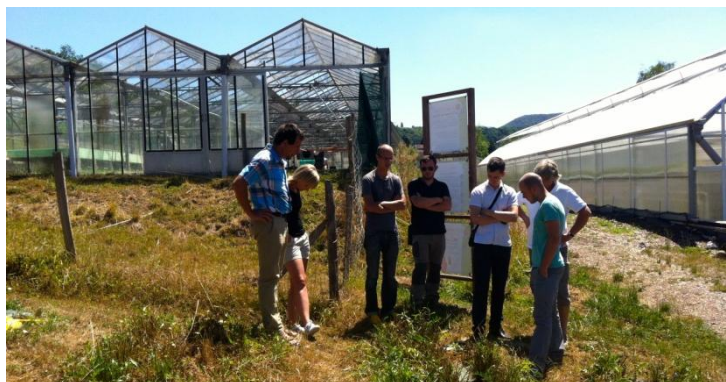
Audit pour la Société OH Semences, juillet 2015

Le Service officiel de contrôle (SOC) assure les audits pour les labels Végétal local et Vraies messicoles. A l'issue de journées de formation ayant eu lieu en juillet et août, les auditeurs ont commencé leurs tournées d'audit. Les 13 candidats aux labels seront audités d'ici la fin du mois de septembre.