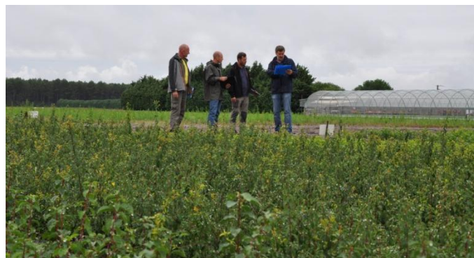
Audit à la pépinière Naudet, août 2015

Les espèces sauvages ne sont pas plus compliquées à produire que les espèces classiques. La difficulté réside en fait dans la multiplicité des lots qui sont généralement de plus petite taille c'est-à-dire avec des poids de graines et donc un nombre de plants cultivés inférieurs à ce que nous avons l'habitude de produire pour les MFR. Pour cela, nous avons dû adapter notre outils de production et nos habitudes. La gestion des lots de graines et des plants reste la même, nous assurons la traçabilité des espèces depuis l'arrivée des graines jusqu'à la livraison des plants chez nos clients ou sur les chantiers. L'augmentation du nombre et surtout de l'importance des projets de ce type devrait normalement pouvoir à terme contenir les coûts de production qui restent cependant supérieurs à ceux d'une production classique.